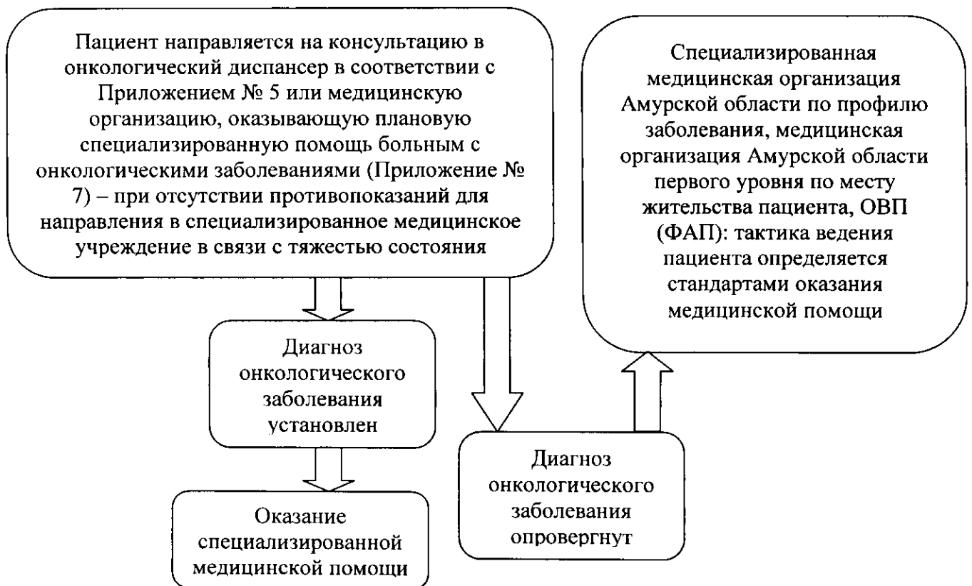
2. Упрощенная схема маршрутизации при подозрении или выявлении онкологических заболеваний в медицинских организациях Амурской области